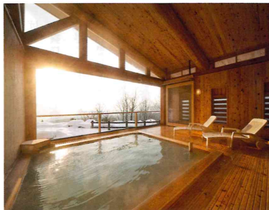
ホテルグランド天空

当社は、新潟より国鉄の新線工事（羽越本線開業に向けて）に伴って、山形、秋田、青森、北海道（旭川）と北上し、羽越本線工事が秋田県においても本格的に始まるなか、現在の由利本荘市に根をおろし今年で109年を迎えます。主に、公共工事の土木、建築、舗装工事の施工をしております。