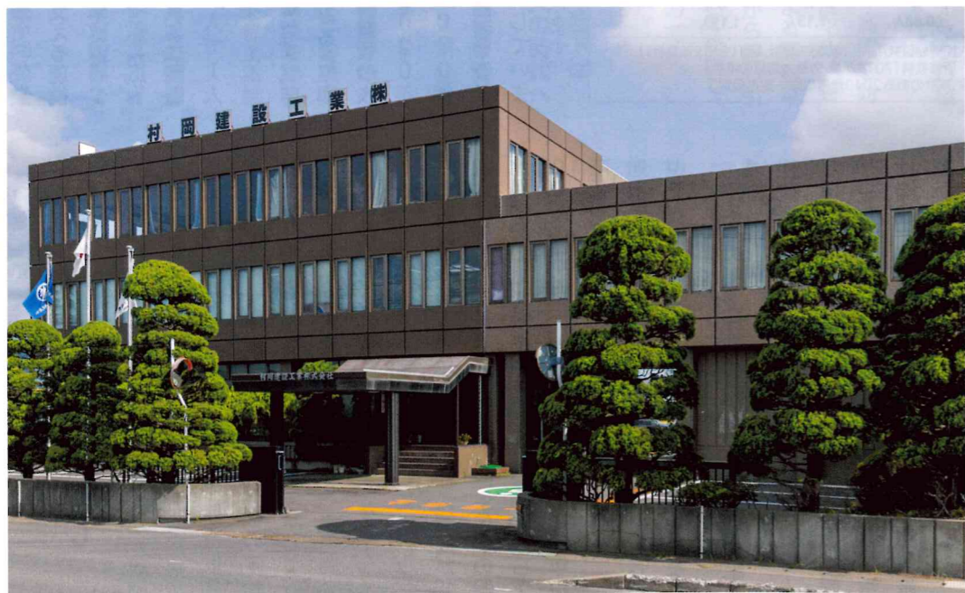
村岡建設工業株式会社社屋

感染症により活動が制限され、委員会事業に多大な影響を受けておりましたが、今年度からは感染症対策を行い、事業活動を再開していく予定です。 信をし、今後の委員会活動を取り組んでいきたいと思っております。全国の社会保険委員の皆様のご活躍をご祈念申し上げます。 （本荘地区社会保険委員会会長）