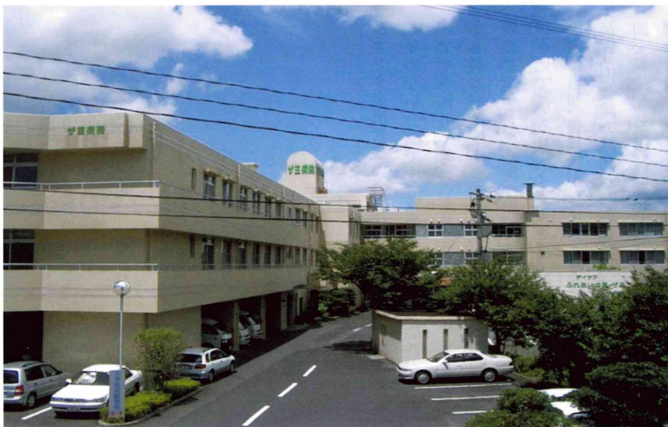
医療法人七徳会 ザ王病院

このような要因の中、現役の方や若い世代において、社会保険に対する関心が低くなっているのが懸念です。社会保険制度の趣旨、目的を理解してもらうためにも、年金委員として研修や情報発信の取り組みをさらに積み重ねていきた