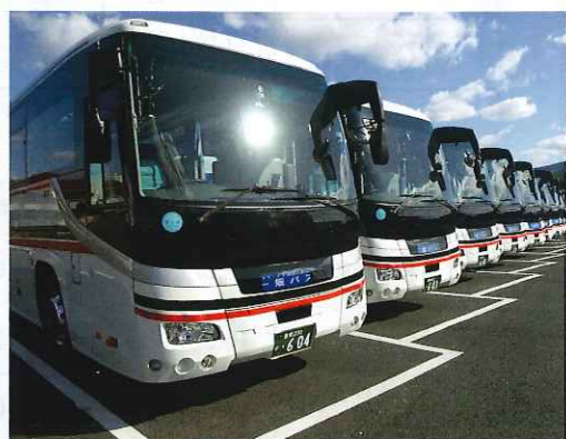
一畑バス 貸切バス車両

まりは、弊社の社名の由来にもなりますが、古来「目のお薬師様」として全国的な信仰を集めた一畑薬師（二畑寺）への参拝客を送る鉄道事業になります。以降、時代の変遷とともに自動車事業への参入、サービス・小売業への事業展開を経て、現在は運輸・観光をグループの中心に置き事業活動を行っております。弊社グループのユニークな事業を紹介させていただきます。弊社グループの一畑電車株式会社では、「デハニ50形体験運転」という事業を実施しています。これは、日本最古級の一畑電車である「デハニ50形」、昭和初期生まれのレトロ電車をお客様が運転できる体験運転イベントで、全国から鉄道ファンのみならず