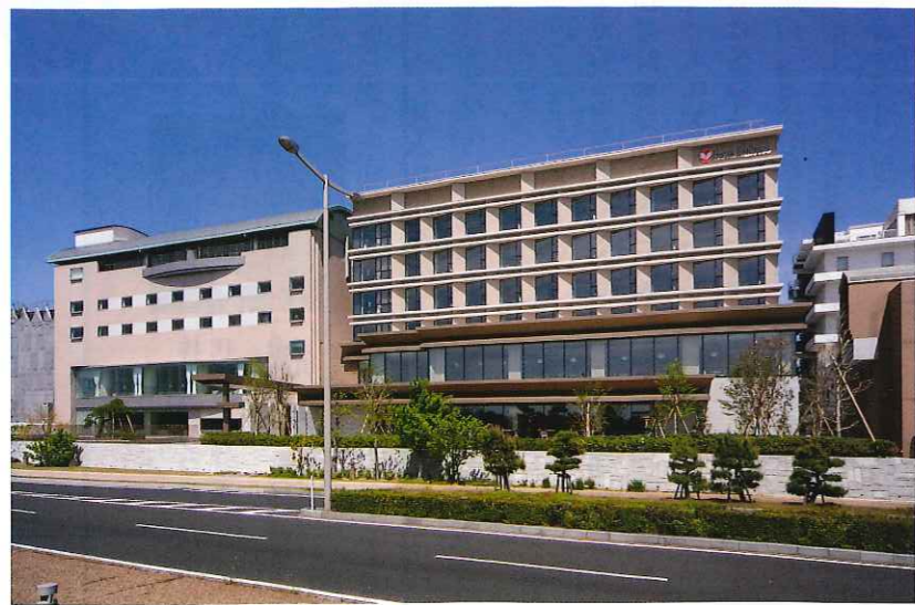
弊社グループが運営する「ホテル一畑」の全館写真

また、毎年1月には松江社会保険委員会役員及び事務局を中心に会議を開催し、事務局から当年度事業の中間報告を受け、翌年度事業計画の策定等を行っています。今後もこの目的を普及、推進していくために会員企業を増やしていきたいかなければなりません。一昨年から世界的なコロナウイルス感染症拡大の長期化、そしてウクライナ情勢による先行きの不透明さもあり、多くの企業が事業運営に影響を受けている状況で、弊社グループも例外ではありません。