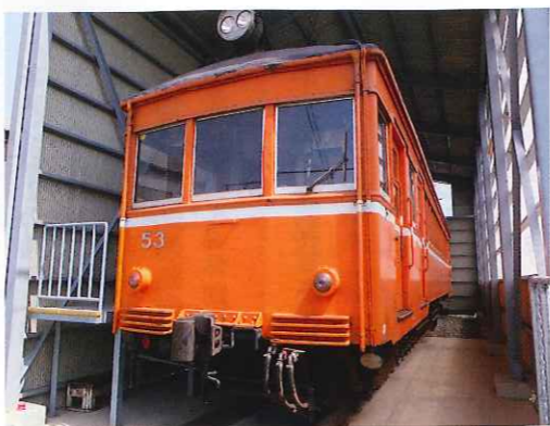
昭和初期生まれの一畑電車「デハニ50形」

まりは、弊社の社名の由来にもなりますが、古来「目のお薬師様」として全国的な信仰を集めた一畑薬師（二畑寺）への参拝客を送る鉄道事業になります。以降、時代の変遷とともに自動車事業への参入、サービス・小売業への事業展開を経て、現在は運輸・観光をグループの中心に置き事業活動を行っております。弊社グループのユニークな事業を紹介させていただきます。弊社グループの一畑電車株式会社では、「デハニ50形体験運転」という事業を実施しています。これは、日本最古級の一畑電車である「デハニ50形」、昭和初期生まれのレトロ電車をお客様が運転できる体験運転イベントで、全国から鉄道ファンのみならず