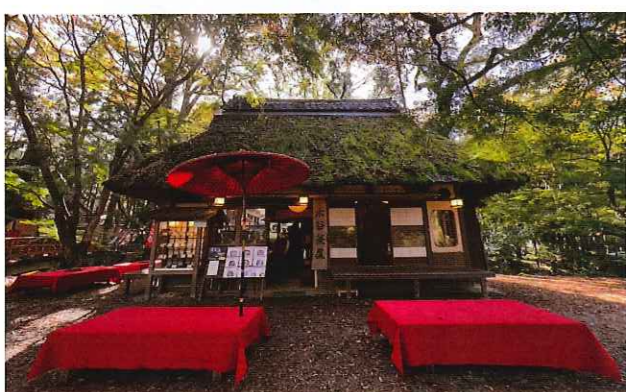
春日山原始林に佇む水谷茶屋