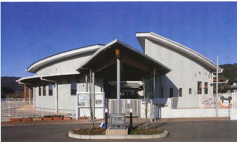
社会福祉法人日向福德会一の宮保育園