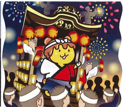
秩父夜祭のポテくまくん