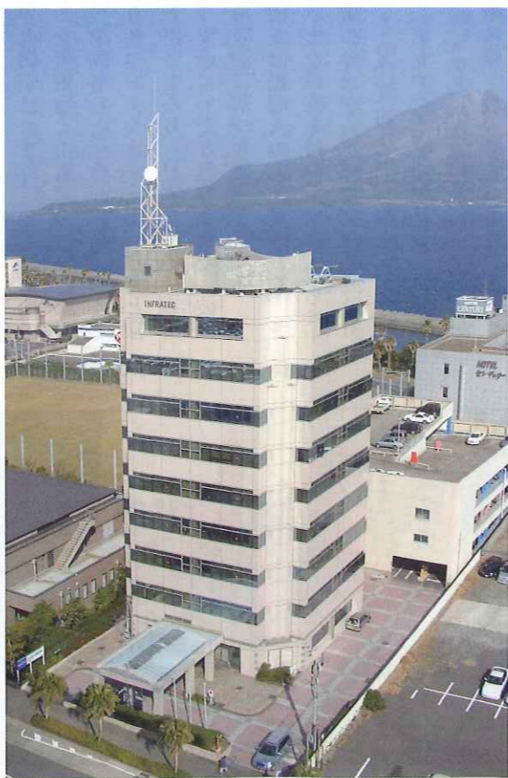
インフラテック株式会社

めて欲しいという気持ちで通常の管理項目にプラスして血液検査項目の追加等を予算の範囲内で行っていましたが、生活習慣病予防健診を受診することで血液検査項目のほかにも検査が増えることがわかり、会社と交渉して実施することになりました。結果、社員にも好評で、以降も継続して実施しています。 年に1度でも自分の健康状態を知ること・気付くことは、異常があった場合でも早期治療につながり、からだへの負担も小さくて済みます。これは、自分自身にとっても家族にとっても大事なことであり、また多くの方と共有している「保険」としての健康保険財政の負担を小さくすることもできます。 自分の健康管理が、社会のしくみにどのようなつながっていくのかというようなことをアナウンスしていくことも、私の役割と認識して今後も活動していきます。 ●今後の委員会活動について 今後の活動として、社内で年金相談や年金セミナーの開催を積極的にやりたいと考えています。 過去、社員が病気で亡くなったときに、家族の方と一緒に年金の手続きに携わったことがあります。そ