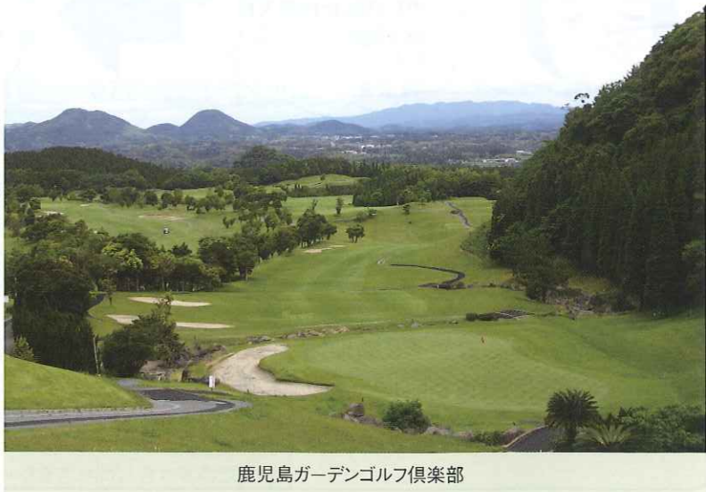
鹿児島ガーデンゴルフ倶楽部