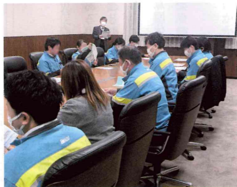
委員活動(ねんきんネット説明会)

また瀬戸内海の多くの島が点在する三原沖の海はタコの産地としても有名で、市内にはタコ料理を売りにす