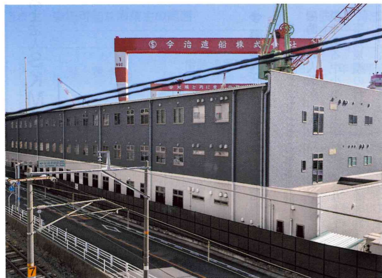
今治造船株式会社 広島工場社屋

しかし、けがをしたり病気になったときに、あまりお金の心配をせず安心して医療機関を受診できるのは国民皆保険の健康保険制度があるからであり、万が一障害を負ったときや老後に一定の収入が得られるのは日本にしかありといた年金制度があるからである、というごく当たり前のことから理解し