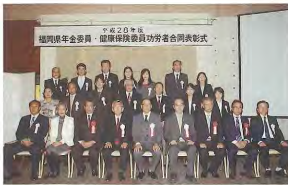
平成28年度福岡県年金委員・健康保険委員有功者合同表彰式

同社は昨年30周年を迎え、創業時の苦労話を聞くとともに、実際に放映の現場を拜見させていただくことができました。元気のある事業所訪問は参加者に大変喜んでいただきました。