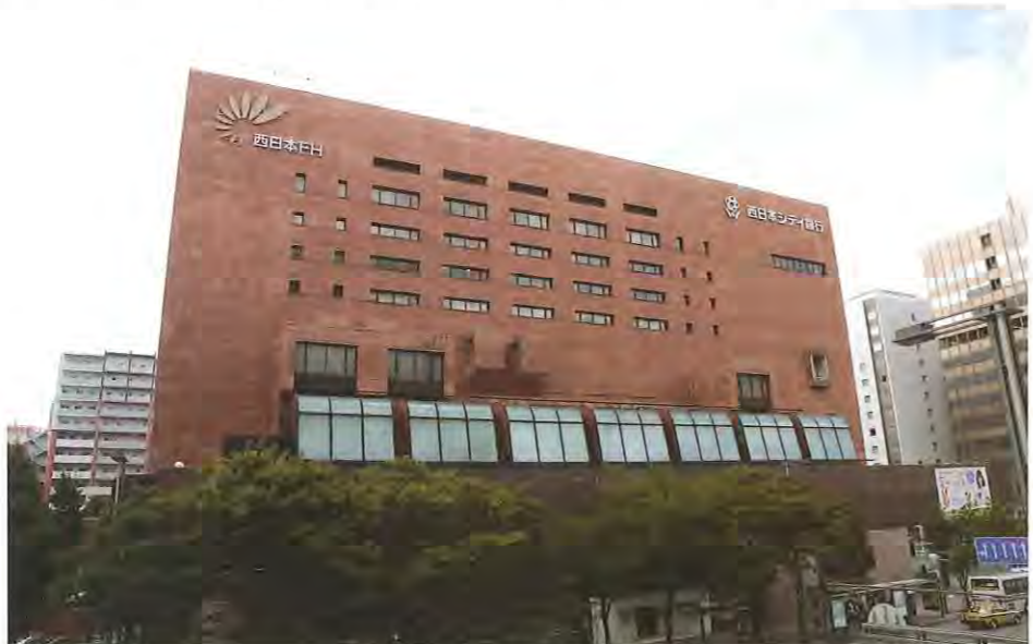
株式会社西日本シティ銀行

私たちの業務は企業にとつて利を生まない、一見、縁の下の力持ちな存在で日の当たらない業務です。保険料も給与から天引きされているため、いくら引かれていくかわからないほど関心の薄い業務ですが、私たち社会保険委員の業務は企業にとつて大切な業務であり、これからの日常生活に密接に関わっている年金・医療・介護などの社会保障のさまざまな改革や法律改正が予想されています。