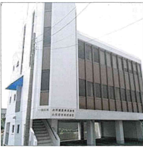
小河運送株式会社 小河梱包株式会社 本社社屋