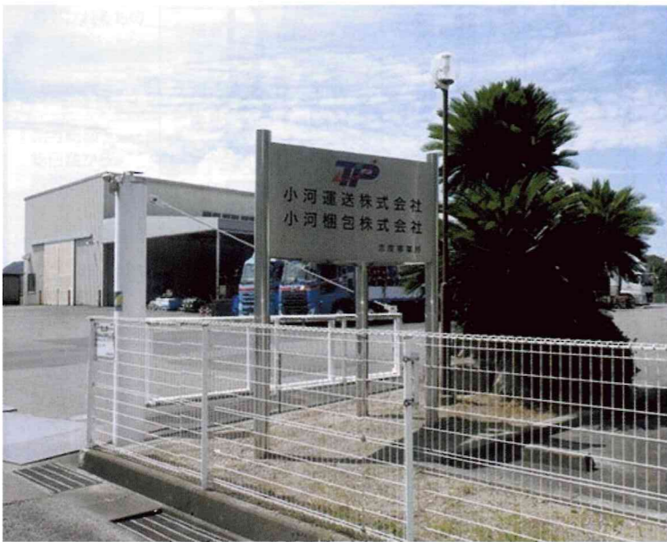
小河運送株式会社 小河梱包株式会社 事業所