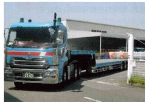
貨物運送トラック

る自動車回送事業と特殊車輛陸送事業、クレーン部品に関する機械部品を木柵梱包後に国内海外へ出荷及び部品管理している輸出木柵梱包事業を営んでおります。