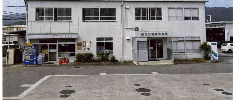
山光石油株式会社社屋

何事も生活環境に慣れるとそれが当たり前のようになり、後退が始まってしまうことに案外気付かないものです。「継続は力なり」といわれるように、健康維持を継続する事は非常にむずかしい事で「自分の健康は自分で守る」を合言葉に、これから受けて終りでない健診結果をしっかりと