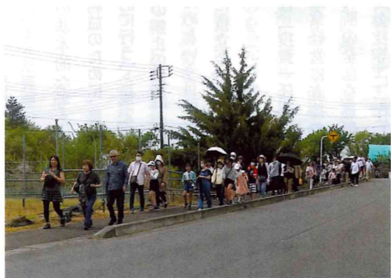
健康づくりウォーキングといちご狩り

また、支部活動として、甲府3支部合同で、例年開催される「健康づくりウォーキングといちご狩り」は