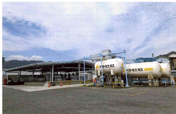
LPガス充填所構内全景

ルギーの安定供給を担って、これからも積極的に取り組んでいきたいと思えます。今後燃料需要は、人口減少やエコカーの普及などを背景に継続して減販が見込まれており、より付加価値の高い商品、EV充電、ライフサービスの提供等、新たな異業種参入の構築が求められております。