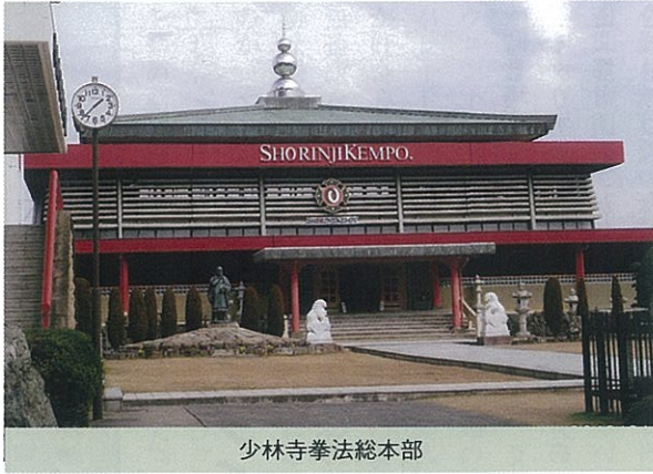
少林寺拳法総本部

連携しながら、5月には役員会、総会を開催して前年度事業報告・決算、新年度の事業計画・予算が審議されました。