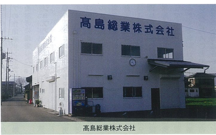
高島総業株式会社

ゴルフ大会や健康ウォークへの参加、夏にはプール利用補助等に各社の従業員及びご家族の皆様も参加対象にして、協力連携し従業員・家族の健康づくりを推進します。